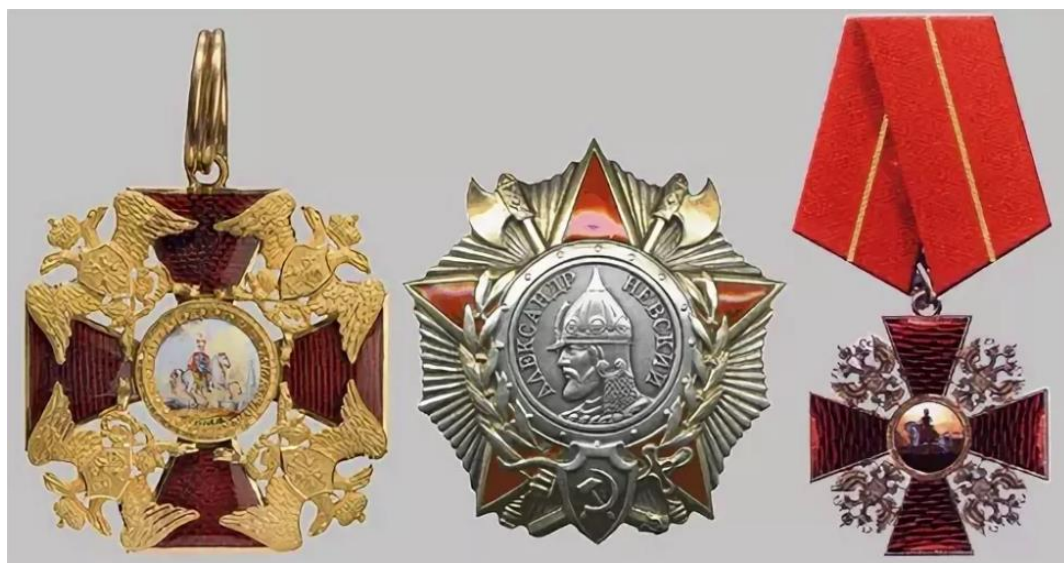
Орден Александра Невского периода СССР

Орденом Александра Невского могут быть награждены видные зарубежные политические и общественные деятели, представители делового сообщества иностранных государств за заслуги в развитии многостороннего сотрудничества с Российской Федерацией и оказании содействия в её социально-экономическом развитии.