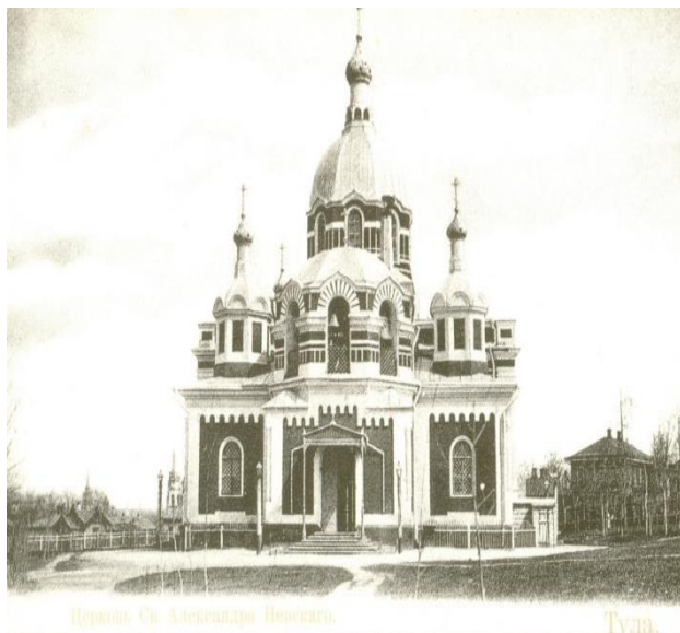
Храм Александра Невского до 1935г