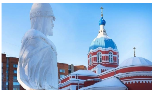
Памятник Александру Невскому, перенесенный на территорию храма