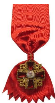
Орден Александра Невского (Российская Империя)