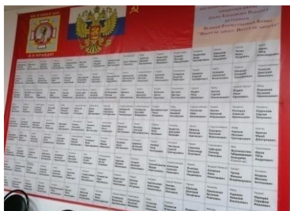
Знамя «Солдатский платок»