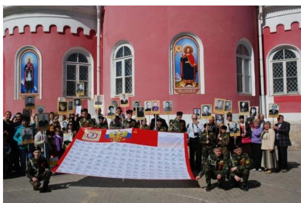
Воспитанники воскресной школы бережно несут знамя «Солдатский платок» с именами участников Великой